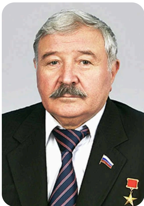
Залиханов Михаил Чоккаевич.

Председатель Попечительского совета, Академик РАН, Герой социалистического труда, почетный профессор МГУ им. Ломоносова.